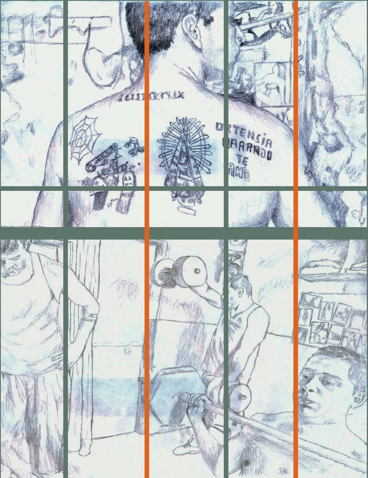
Ilustraciones gráficas basadas en la cárcel de Villa Urquiza en Argentina